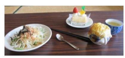
1月7日 七草粥を食べる会