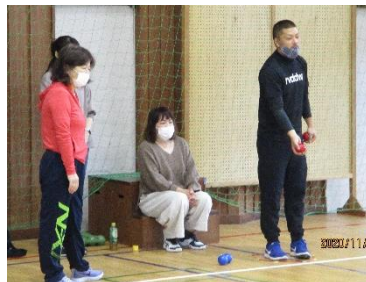
Bグループ優勝 東須賀チーム