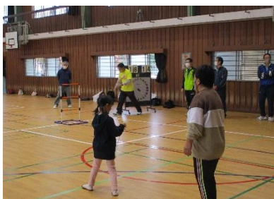
Aグループ優勝 東町・大江混成チーム

11月8日(日)に新居浜小学校体育館にて、室内ペタンク、ラダーゲッター大会が開催されました。参加8チーム中、Aグループ優勝は東町大江混成チーム、Bグループでは東須賀チーム優勝しました。選手の皆さま並びにお世話してくださいました体育振興会役員の皆さまご苦労さまでした。