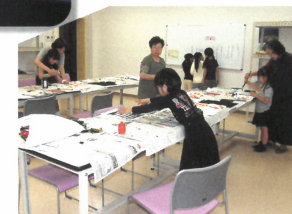
体験学習室での活動