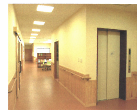
エレベーター入口から 休憩コーナーを望む