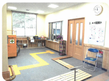
玄関ホール（中央奥：事務室）