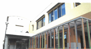
玄関横のスロープ