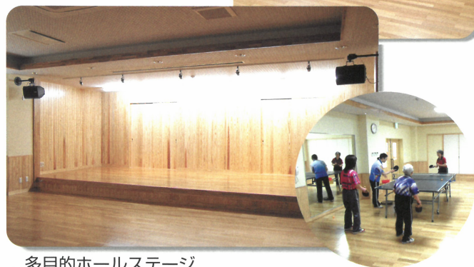
多目的ホールステージ