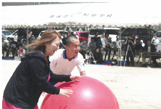
平成30年度<愛顔スマイル大賞> (愛媛県立宇和特別支援学校)