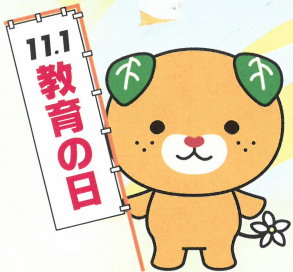
愛媛県イメージアップ キャラクター みきゃん