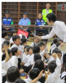
新居浜市防犯協会泉川支部