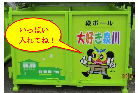
常設された資源ごみ回収の「いずどんBOX」

「いずどんBOX」は常設で、いつでも資源ごみを投入できますので、みなさんのご協力をお願いします。 回収した資源ごみの収益金は、子どもたちの公民館カレーの日等の経費に活用させていただきます。 みなさん資源ごみ・ダンボール・新聞・雑誌・アルミカンを持って「いずどん」に会いに来てくださいます。 お待ちしております。