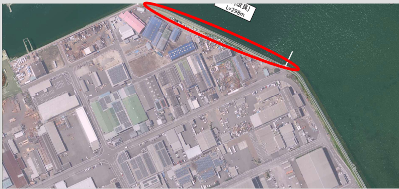
↑ 港湾・海岸補修事業 (阿島)