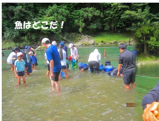
けんめいに魚の搜索中