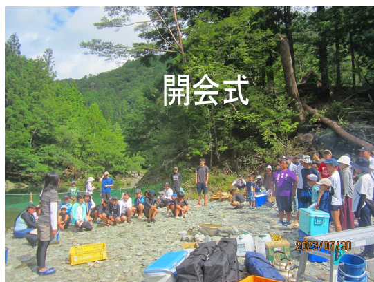
参加者 総勢 112名(スタッフも含め)

さらに、魚つかみで冷えた身体を温める「ドラム缶風呂」も地域の方のご厚意で設置いたしました。ありがとうございました。