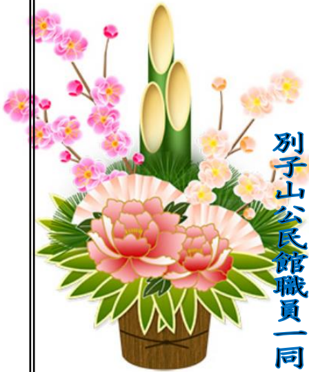
別子山公民館職員一同