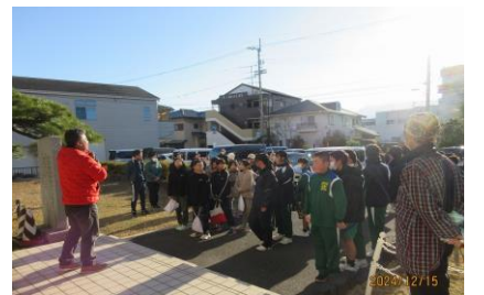
【公文部会長の開会のあいさつ】

当日は天候が心配されましたが、絶好の天気恵まれ、北中のボランティアやお父さん、お母さん、おじいちゃん、おばあちゃんに杵の使い方やもちの丸め方を教えてもらいながら、日本の伝統を学んだ1日となりました。