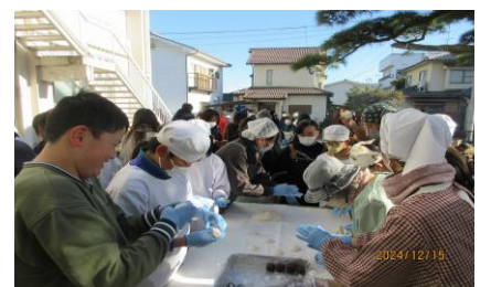
【もち丸めも貴重な体験でした】