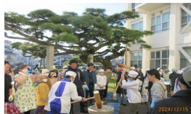
【もちの完成まで大変な作業です】