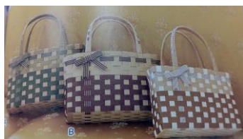
グリーン・ココア・モカ