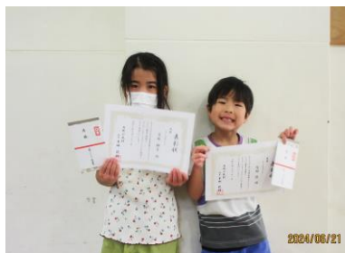
←優勝：チームばこし

6月1日に開催されました角野ウォークラリーの表彰式を6月21日に、角野小学校において行いました。1位～5位になったお子さんたちは、賞状と副賞に大喜びで、大変良い表彰式になりました♪ また来年も開催しますので、参加よろしくお祈りします。