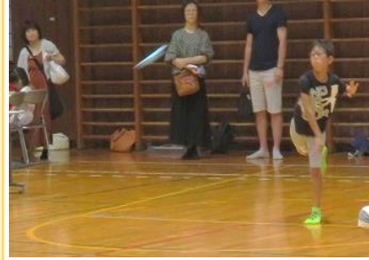
～かみひこうき大会～