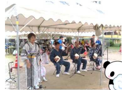
↑初参加の三味線演奏で会場を盛り上げてくれました。