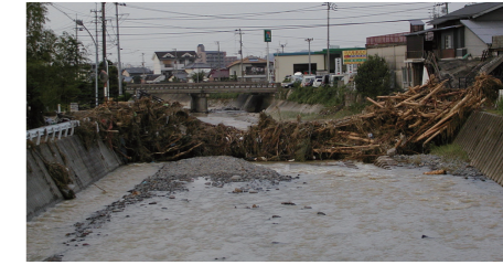
2004年(平成16年)10月1日 滝の宮町