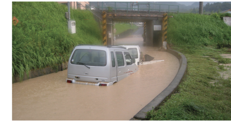
2004年(平成16年)8月18日 神郷

ハザードマップはあくまでも想定図ですが、本ハザードマップを活用して事前に災害をイメージし、避難行動について準備することができれば、いざという時に慌てずに行動することができます。本ハザードマップには、さまざまな防災に関する情報を掲載していますので、あらかじめ目を通していただき、みなさん一人ひとりの災害に対する日頃の備えに役立ててください。