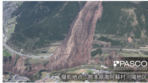
2016年(平成28年)「熊本地震」

この総合防災マップ(ハザードマップ)は、新居浜市で想定される災害(地震・津波・洪水・土砂災害・ため池・高潮)に関する情報のほか、災害情報の入手方法やマイ・タイムラインの作成など、より実用的な内容となっております。ご家庭のみならず地域や職場など、あらゆる場面でご利用いただき、災害時に備えていただきたいと思います。