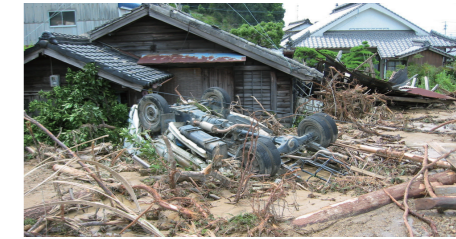
2004年(平成16年)8月20日 神郷