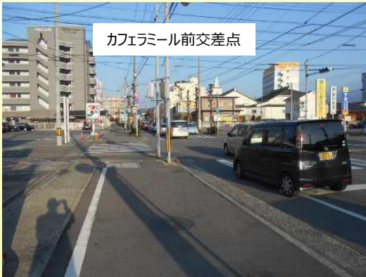
カフェラミール前交差点