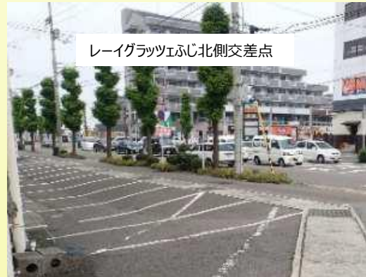
レイグラツェふじ北側交差点