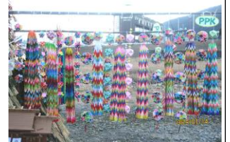
一年をかけてのお守りや鶴、飾り折り紙のご協力ありがとうございました。