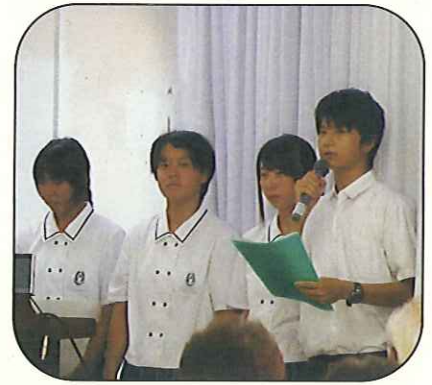
新居浜南高校ユネスコ部