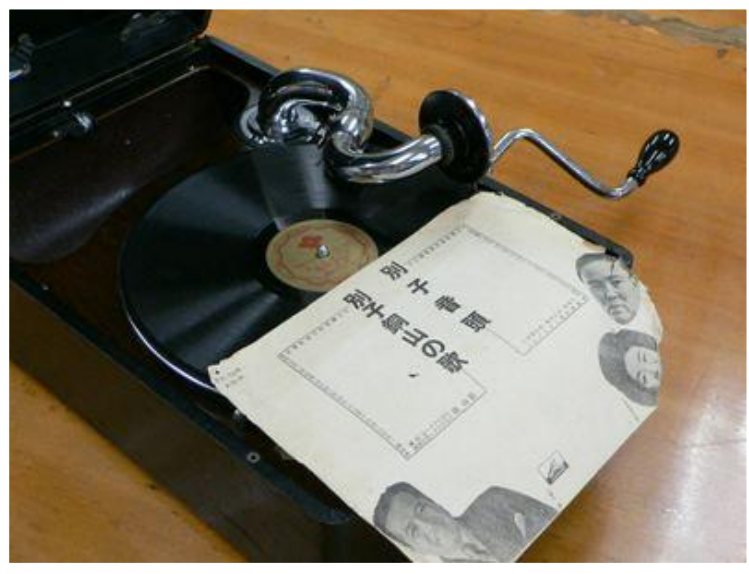
↑蓄音機の上のレコードとジャケット