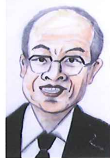
(ハーモニカサークル コンテニュー)