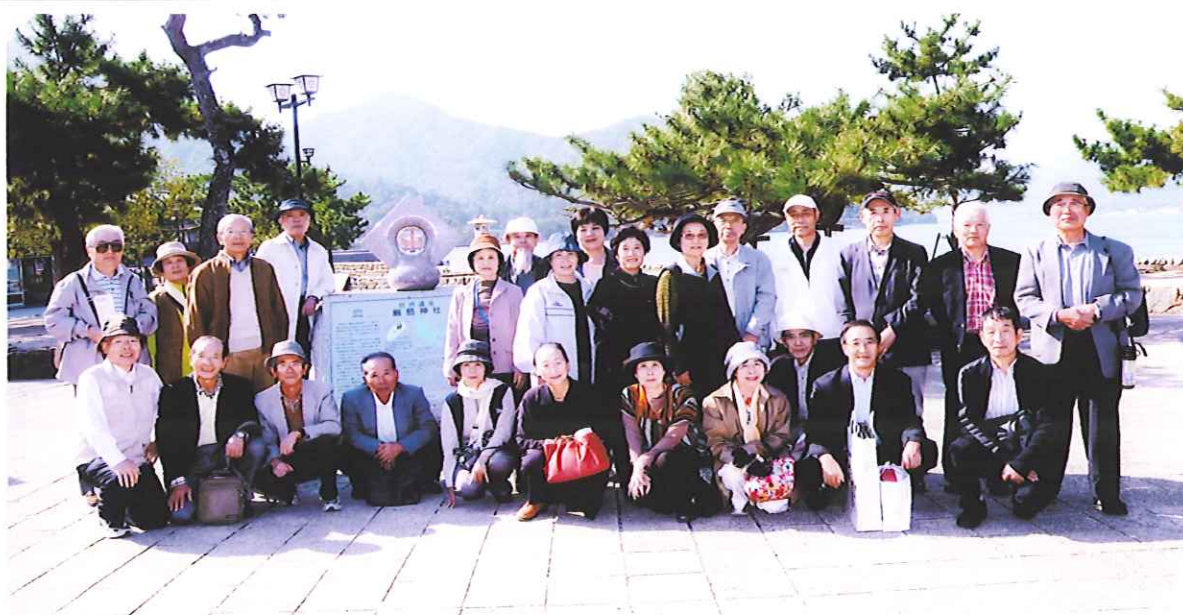
平成24年度 講師・代表者会 研修旅行 2012年10月26日 於：世界遺産 安芸の宮島