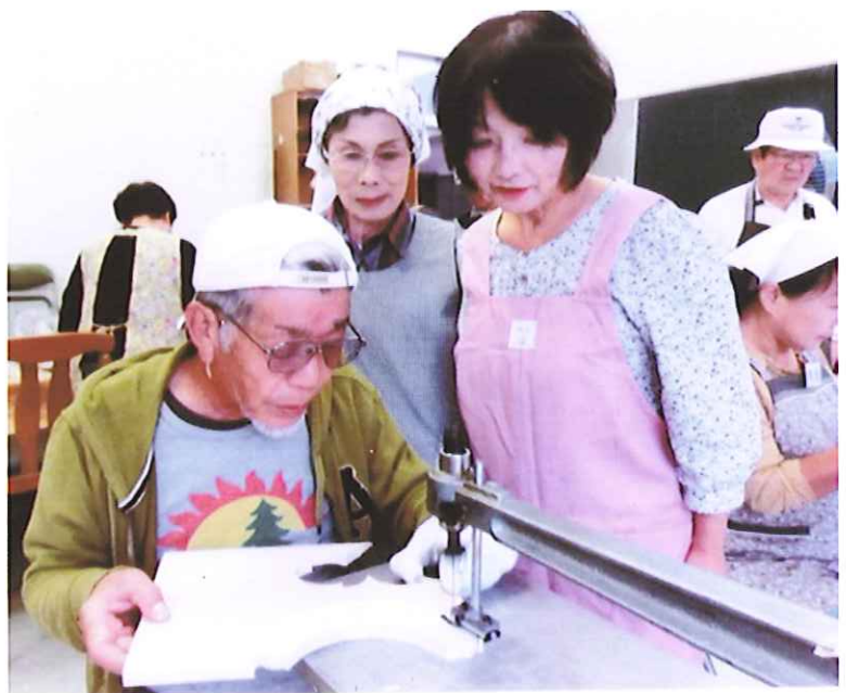
(電動糸のこを使って作品づくり)