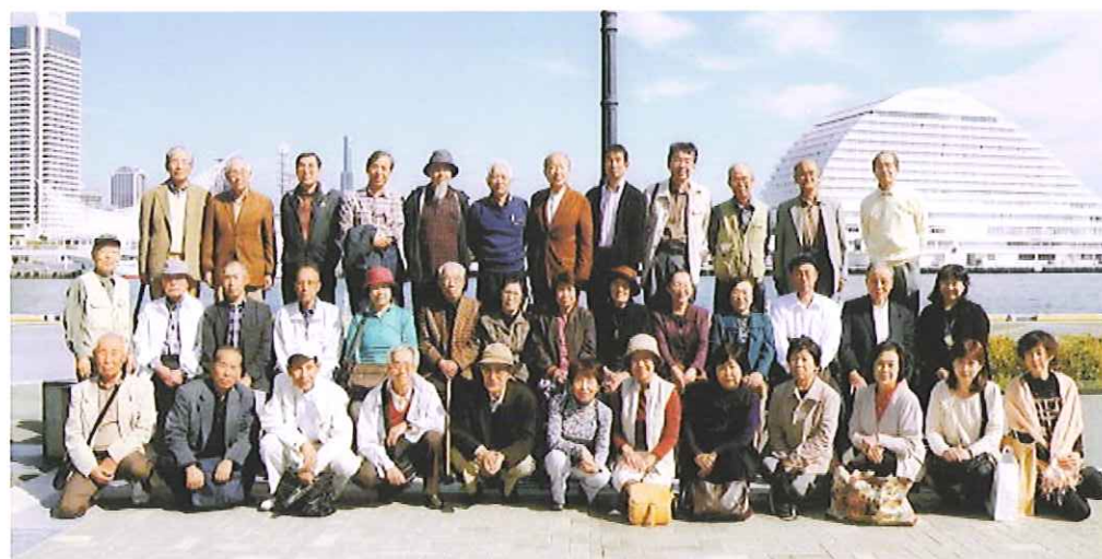
平成23年度 講師・代表者会 研修旅行 2011年10月28日 於：神戸市