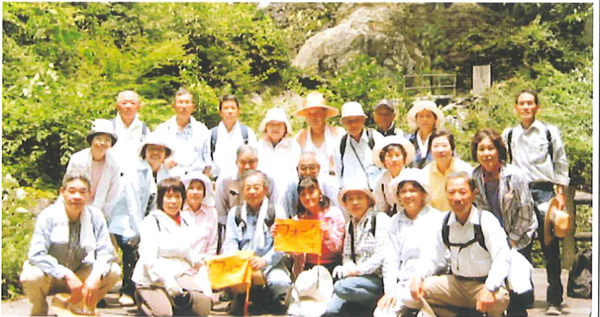
「健康で百歳めざして」活動されているウォーク2005の皆さん