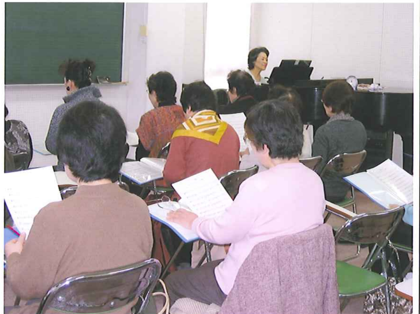
コーラス教室の授業風景