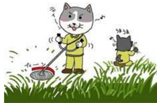
別子校区連合自治会