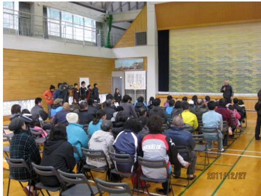
福島県児童の受け入れ式