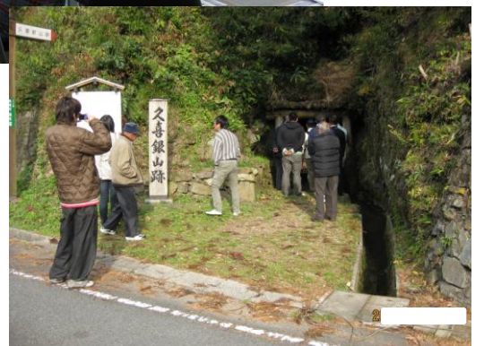
銀山跡の間歩を見学