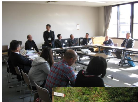
邑南町出羽公民館で、地の皆さんとの交流会

交流会の中でも、出羽町の取り組みを御紹介いただきましたが、地域づくりに必要なものは、人づくりで、まちづくりには人と人の絆が必要であるなど、地域を思う気持ちの一つにして前に進む姿は、非常に素晴らしいものと感じましたし、別子山地域の今後非常に参考となるものでした。