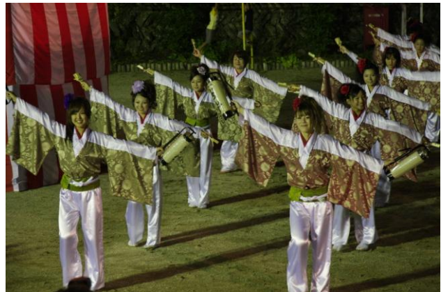
新居浜よさこいチームの皆さん