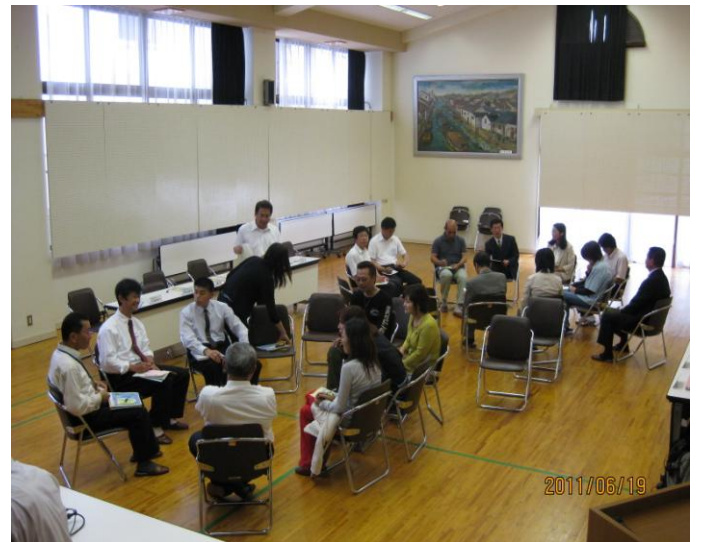
子育て井戸端会議の様子