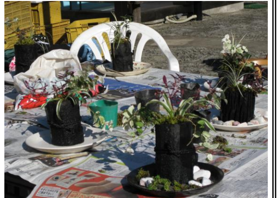
炭山水 (山野草等を埋め込みデザインしたもの)