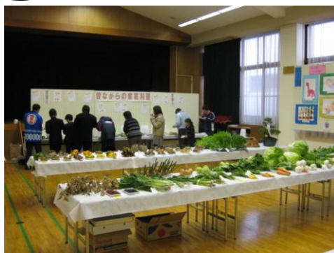
産業農産物等展示