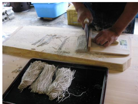
そば打ち試食用そば