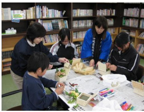
文化・アクセサリ作り