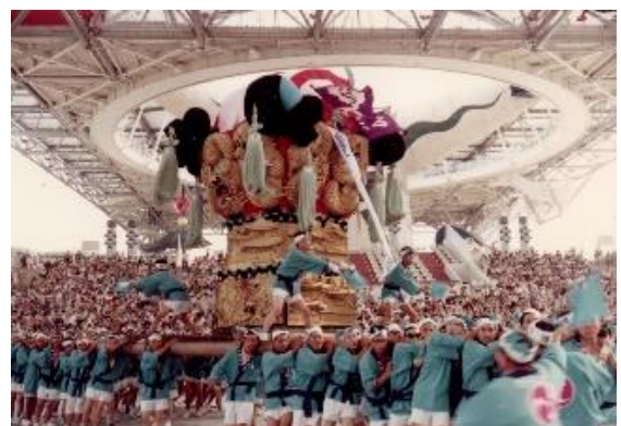
1970年大阪万国博覧会(大江・江口) 白い短パン姿が衝撃的。

住友グループが出展する『住友館』にも注目です。海に浮かぶ人工島に“住友の森”の樹木を使用し、住友グループ発展の礎となった別子銅山の峰をモチーフとしたパビリオンなのだそうです。山々が連続するシルエットを表現した屋根や外壁は圧巻です。1970年に植林した木も使われるとか。伐採したあとには新たな苗木を植え未来に続く森づくり。時を超えて循環するパビリオンのあり方はさすがですね。