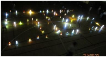
【ペットボトルとスマホでSOS】