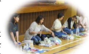
【非常持出し袋の中身は?】 【地域ごとに危険箇所チェック】

避難経路の危険箇所を地図にまとめたり非常持出し袋の中身を紹介したり、次世代ネットワークからのクイズに答えたりとたくさんの学びがありました。