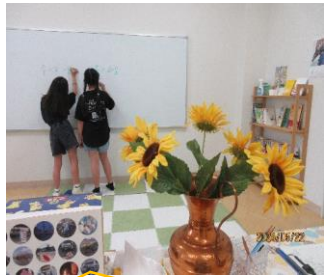
子どもたちがたくさん利用してくれています。

ご協力いただける方は公民館までご連絡ください。よろしくお願ひします。 【TEL 32-8430】