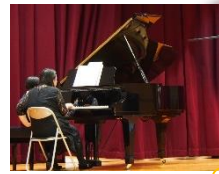
小・中学生が大活躍!