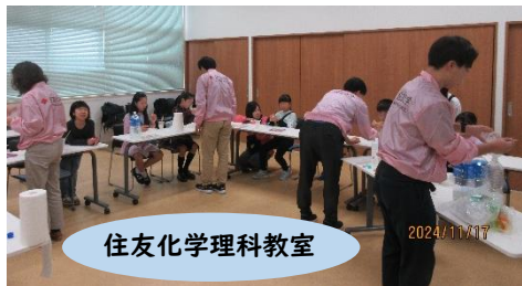
住友化学理科教室