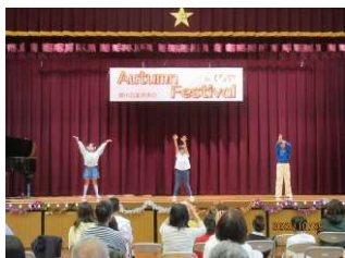
北中学校生が企画運営「Autumn Festival in くちや」