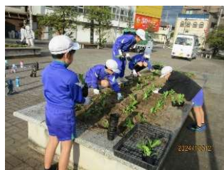
宮西小3年生対象の「憩いの森」花壇苗植え