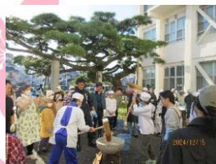
宮西小5・6年生対象の「三世代交流もちつき」