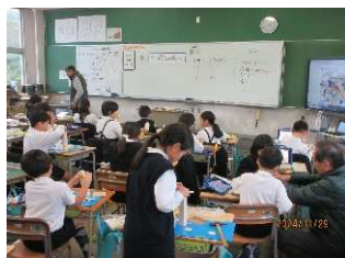
宮西小3年生対象の「かなづち先生」木工指導