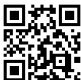
宮西校区まちづくり協議会ホームページ