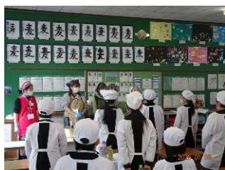
宮西小4年生対象の「七草粥講座」

宮西校区まちづくり協議会では、子ども応援部会が中心となり、地元の宮西小学校の児童や北中学校の生徒と地域の方がいっしょになり、様々なまちづくり活動を行っています。こういった活動を継続することにより、子どもたちに地域への愛着や誇りを育み、地域の将来を担う人材の育成を図るとともに、子どもたちの豊かな成長にもつながり、人づくりと地域づくりの好循環を生み出すことにつながっていくことが期待されます。