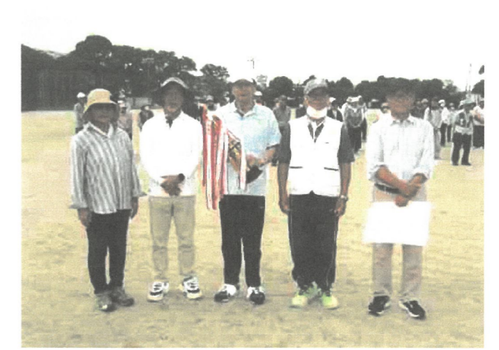
団体B・優勝 GG教室Aチーム