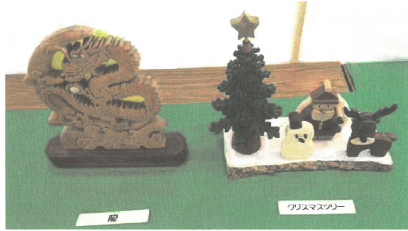
クリスマスツリー