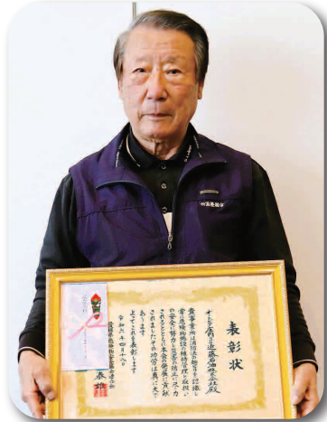
オートピア庄内SS 近藤石油(株)