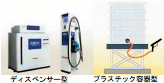
ディスペンサー型