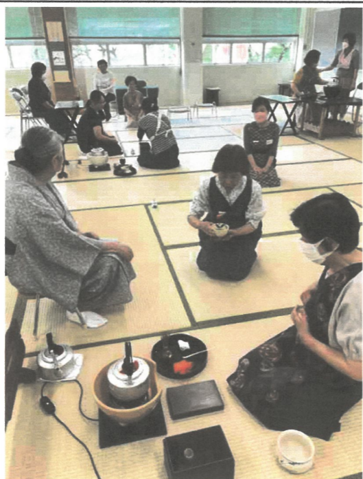
先生の前でお点前の稽古

※状況により予定を変更する場合がございます。最新の情報または詳細は各サークル代表者にお問い合わせください。