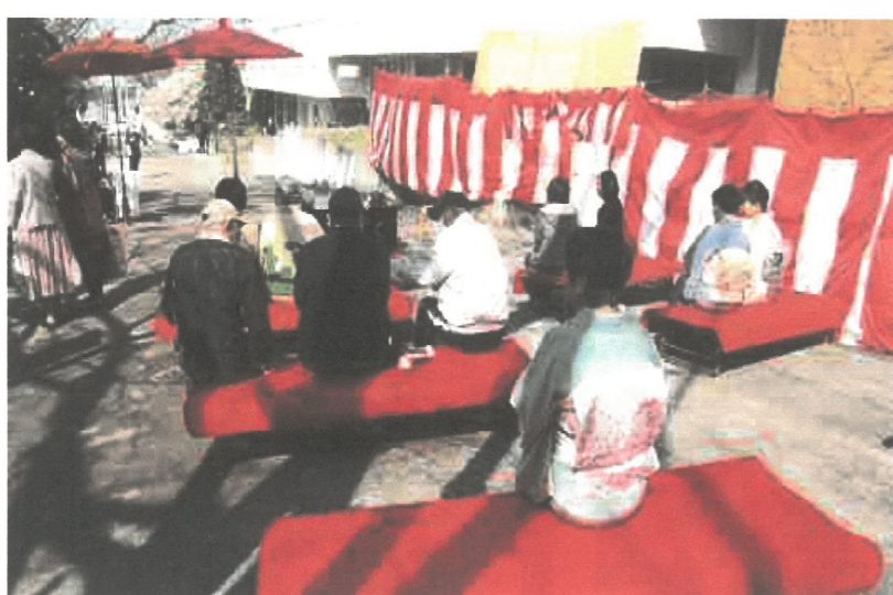
学園祭の野点の様子