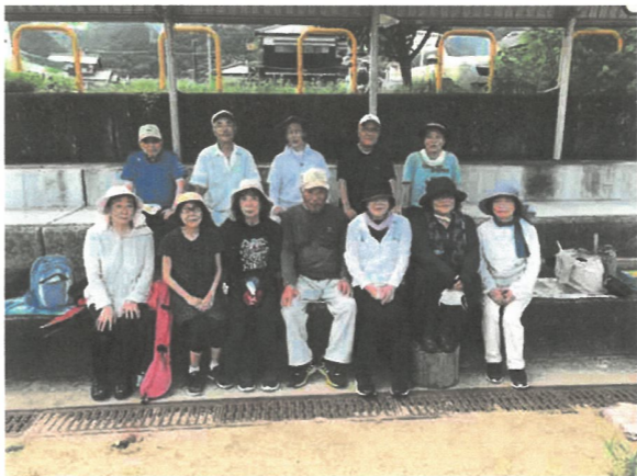
あかがねGGの皆さん

そして、「サークルあかがね」が出来たとき、あまり熱心じゃない私は、週1回、月2回程度の練習なら出