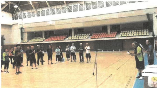
結果発表・表彰式 皆様、お疲れ様でした。