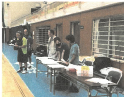
開会式・ルール説明

開催日：令和6年9月10日 開催場所：新居浜市民体育館 参加者：卓球サークル (桃山)A・B・C・D・E より合計90名 担当サークル：桃山A