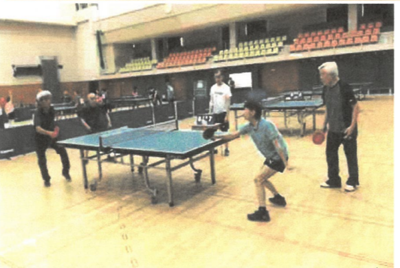
試合風景 熱戦の様子!