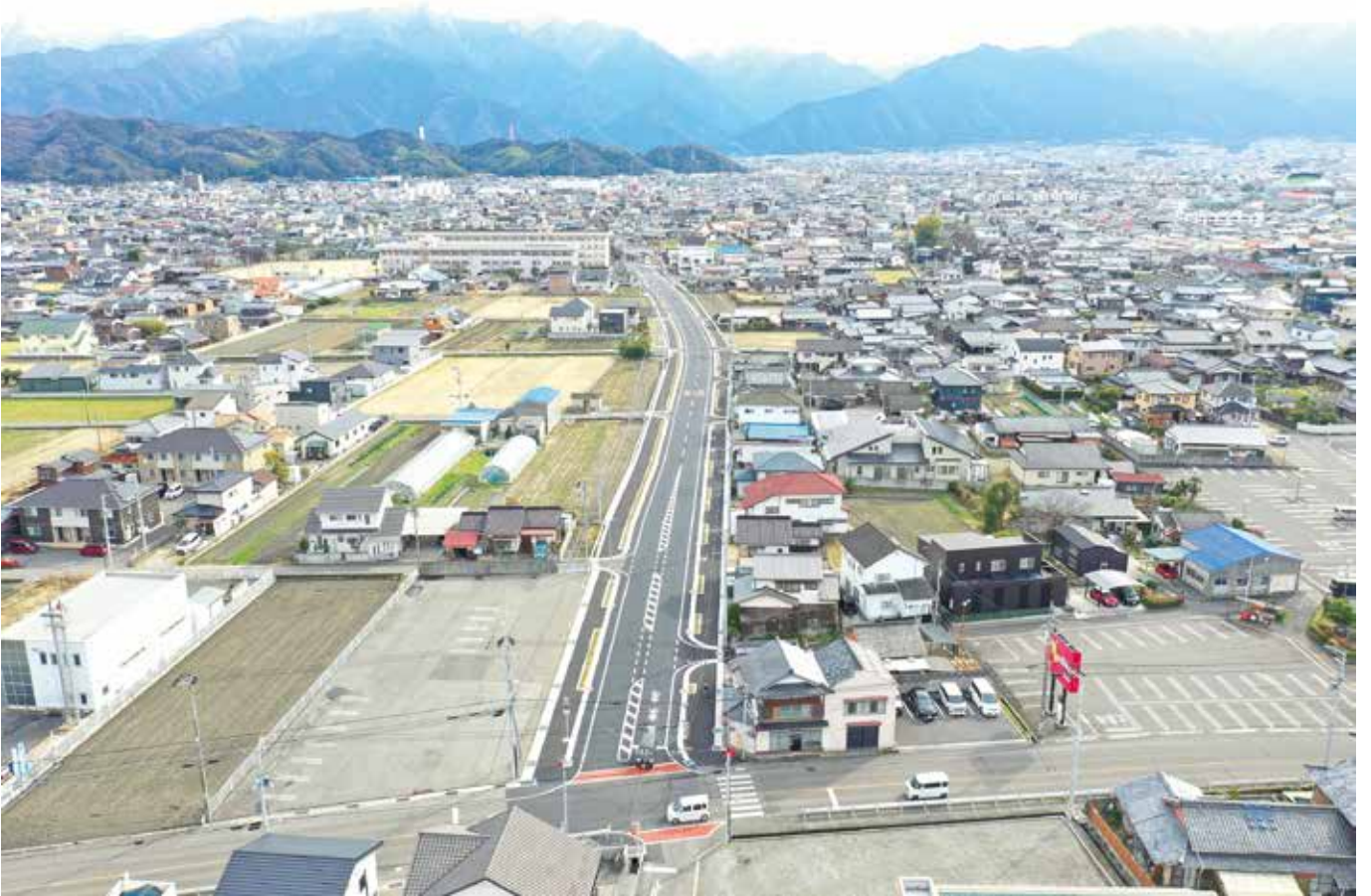
都市計画道路 宇高西筋線