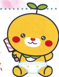
愛媛県こみきゃん