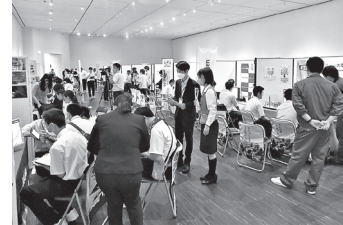
▲お仕事フェスタ 2023の様子