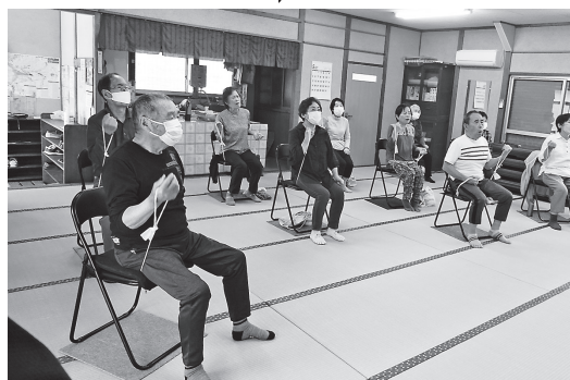
佐藤さんの祖母が参加する 三軒屋拠点での体操の様子

《三軒屋拠点最年長 89歳女性》 拠点ができる約3年通い続けている。 寝たきりにならないようにこれからも 続けるつもり。ここがあって良かった!