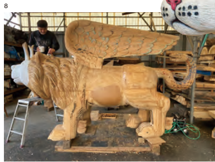
1 | Animal 2007-03 2007 樟、油彩 211×81×108cm クマ 2 | Painting 2022-32 2022 パネル、アクリル 182×183cm キメラと小鳥 3 | Painting 2022-04 2022 パネル、アクリル 180×89.5cm キリン 4 | Bird 2007-01 2007 樟、油彩 62×166×72cm カンムリワシ 5 | Dog 2010-03 2010 樟、油彩 57×21×73cm プルテリア 6 | Painting 2022-09 2022 キャンバス、アクリル 91×116.7cm ユニコーン 7 | Animal 2012-01 2012 樟、油彩 131×76×292cm ホワイタイガー 8 | キメラ制作中 2020