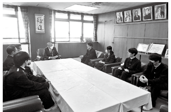
生徒代表の6人が議長室を訪れました

傍聴終了後、代表生徒が議長室を訪れ、正副議長にあいさつし、「自分たちの生活に関わる質問があり身近に感じることができた」など、傍聴した感想を述べました。