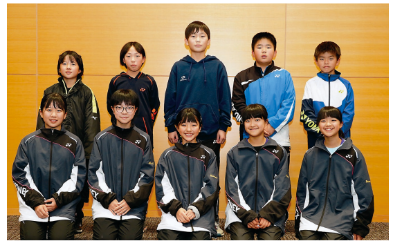
第 32 回全国小学校バドミントン選手権大会への出場が決定した新居浜ジュニアバドミントン連盟所属の皆さん。