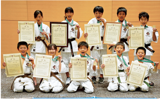
2023 年少林寺拳法世界大会 in Tokyo, Japan 団体演武（アンダー 12）で最優秀賞を受賞した新居浜瀬戸道院拳友会所属の皆さん。