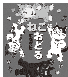
「ねこおどる」 絵本館 広瀬克也／作