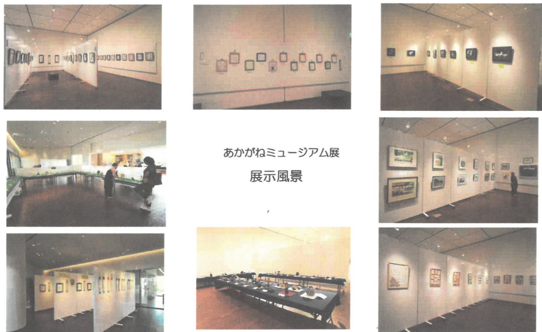
あかがねミュージアム展 展示風景