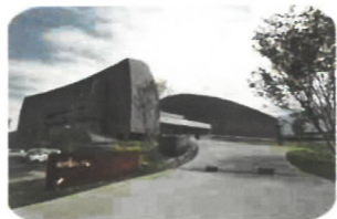
趣味の作品 あかがね ミュージアム展 開催