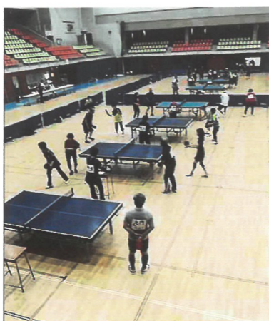
前ページより熱戦続く