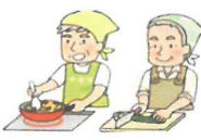
芋たき 麦茶で乾杯

美味しんぼの良さは、みんなで調理し、出来立てをみんなで食べること、家でも楽しめることだと思います。多少の失敗はあっても、自分たちが作ったものをすぐ食べる。わいわい言いながら食べる。そしてまた一カ月後に集います。