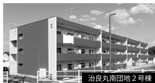
治良丸南団地2号棟