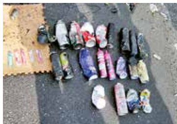
燃やすごみに混ざっていた スプレー缶など

火災事故は、収集にあたる作業員や収集車、周辺の建築物に被害が及び、人命に関わる重大な事故となります。また、清掃センターでの処理中に発火すると、ごみの処理・収集が止まってしまう。他市町村では、火災事故の原因となるごみを出した人が損害賠償責任を問われる事例も発生しています。絶対にモバイルバッテリーや、中身が残ったままのスプレー缶・ライターを「燃やすごみ」で出さないでください。