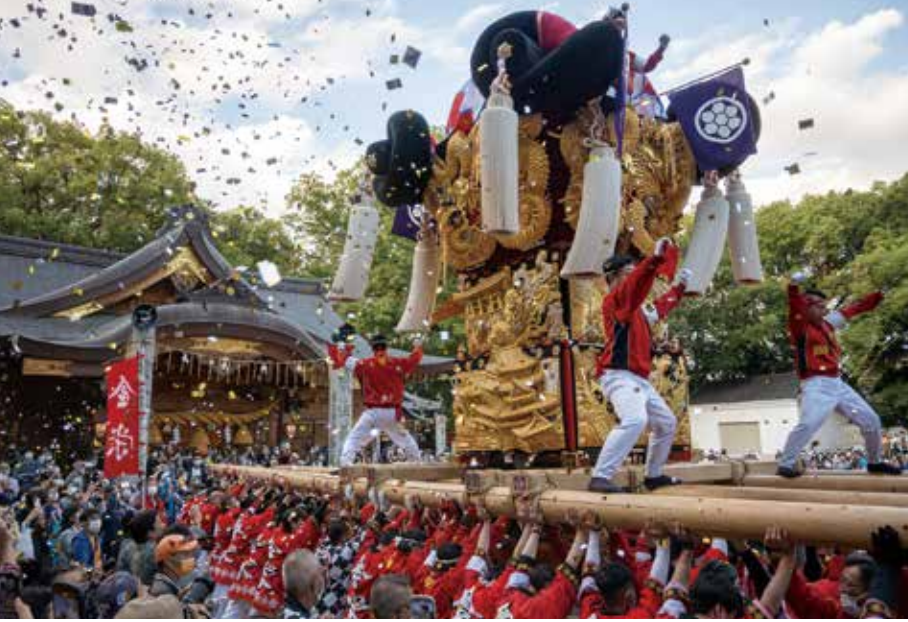
2022年新居浜太鼓祭り写真コンテスト グランプリ（新居浜市観光物産協会賞） 「歓喜の宮入り」

今年も秋祭りの時期となりました。昨年の新居浜太鼓祭りは、コロナ禍の中で、感染の拡大防止に向けた取り組みを徹底しながら3年ぶりの開催となりましたが、一部の会場で太鼓台同士のけんかが発生する、残念な結果となりました。今年も4年ぶりの通常開催となります。誰もが気持ちよくお祭りを楽しめよう、平和祭典の実現に向け取り組みましょう。