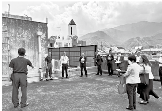
南消防庁舎(屋上) 現地調査

南消防庁舎の現状について、現地調査を行いました。外壁の汚れや亀裂、天井の破損などの施設の老朽化や、職員の増員、車両の増車による施設の狭隘化 きょうあい について調査しました。