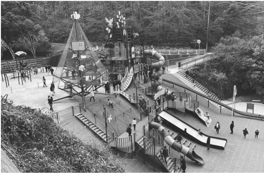
滝の宮公園 大型複合遊具