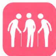
高齢者向けサロン

ひとりひとりの小さなお金。そのお金に「誰かの助けになりたい」という気持ちがこもって十人、百人、千人と集まれば、大きな力に変わります。赤い羽根は、小さなことをしています。小さな活動をたくさん、何十年と続けています。つまり、赤い羽根は、大きなことをしています。