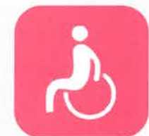
福祉施設・団体に車いす