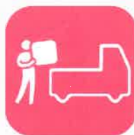
障がい者が働く作業所に支援