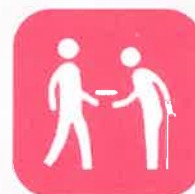
高齢者への配食サービス