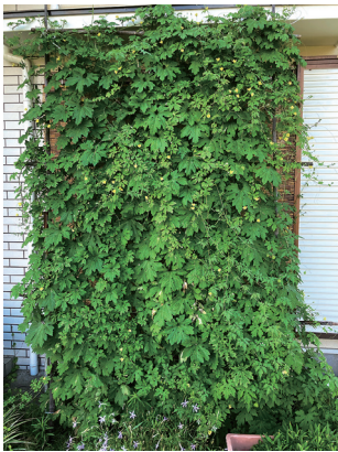
最優秀作品 クレマチスさん

今年も家庭でできる省エネ対策として「みどりのカーテン」普及啓発のため、フォトコンテストを開催しました。「みどりのカーテン」は、ゴーヤなどのツル性植物をカーテン状に育成したもので、見た目の涼しさだけでなく日射をさえぎり、放射熱を防ぐことで、節電やCO2削減に効果があり、地球温暖化抑制にもつながる取り組みとされています。審査の結果、最優秀作品1点、優秀作品2点が決まりました。ご応募いただいた皆さん、ありがとうございました。