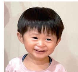
萬條颯斗ちゃん 我が家の癒し担当ふう ちゃん♡2歳おめでとう!!!