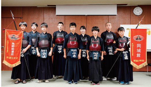
第56回全国道場少年剣道大会への出場を決めた岡城館、角野剣道会の皆さん