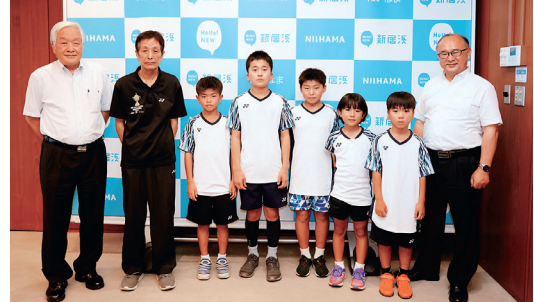
第23回ダイハツ全国小学生ABCバドミントン大会への出場を決めた市内ジュニアバドミントンクラブの皆さん