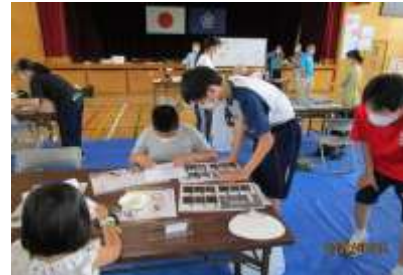
新居浜東高生のボランティアさん ありがとうございました

令和4年6月25日神郷小学校体育館でまちづくり委員会健全育成部主催の折り染め教室が開催されました。小学生親子50名の参加で、新居浜東高等学校のお兄さんお姉さん17名がボランティアで手伝ってくれました。障子紙を工夫して折って染めると不思議な幾何学模様になりそれを団扇に貼って世界で一つだけのオリジナル団扇が完成しました。