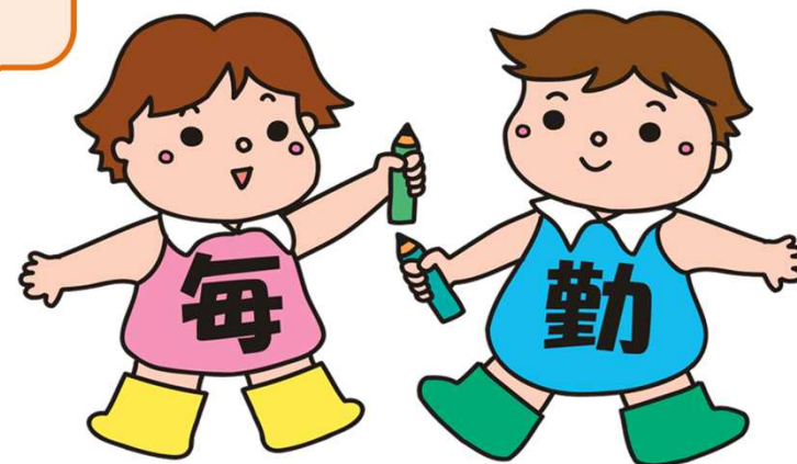
毎月勤労統計調査のキャラクター「まいちゃん きんちゃん」