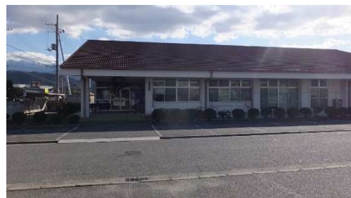
【07号の答】「神郷小学校体育館」でした。