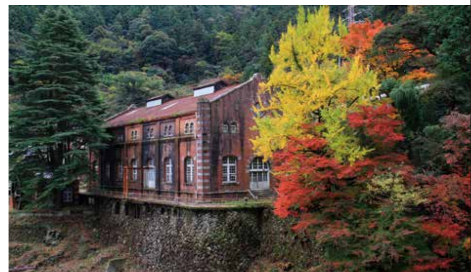
舊端出場水力發電站