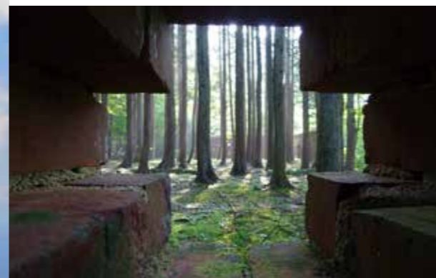
舊別子銅礦山地區 the first prize 2017 Akagane Photo Contest Winning Works