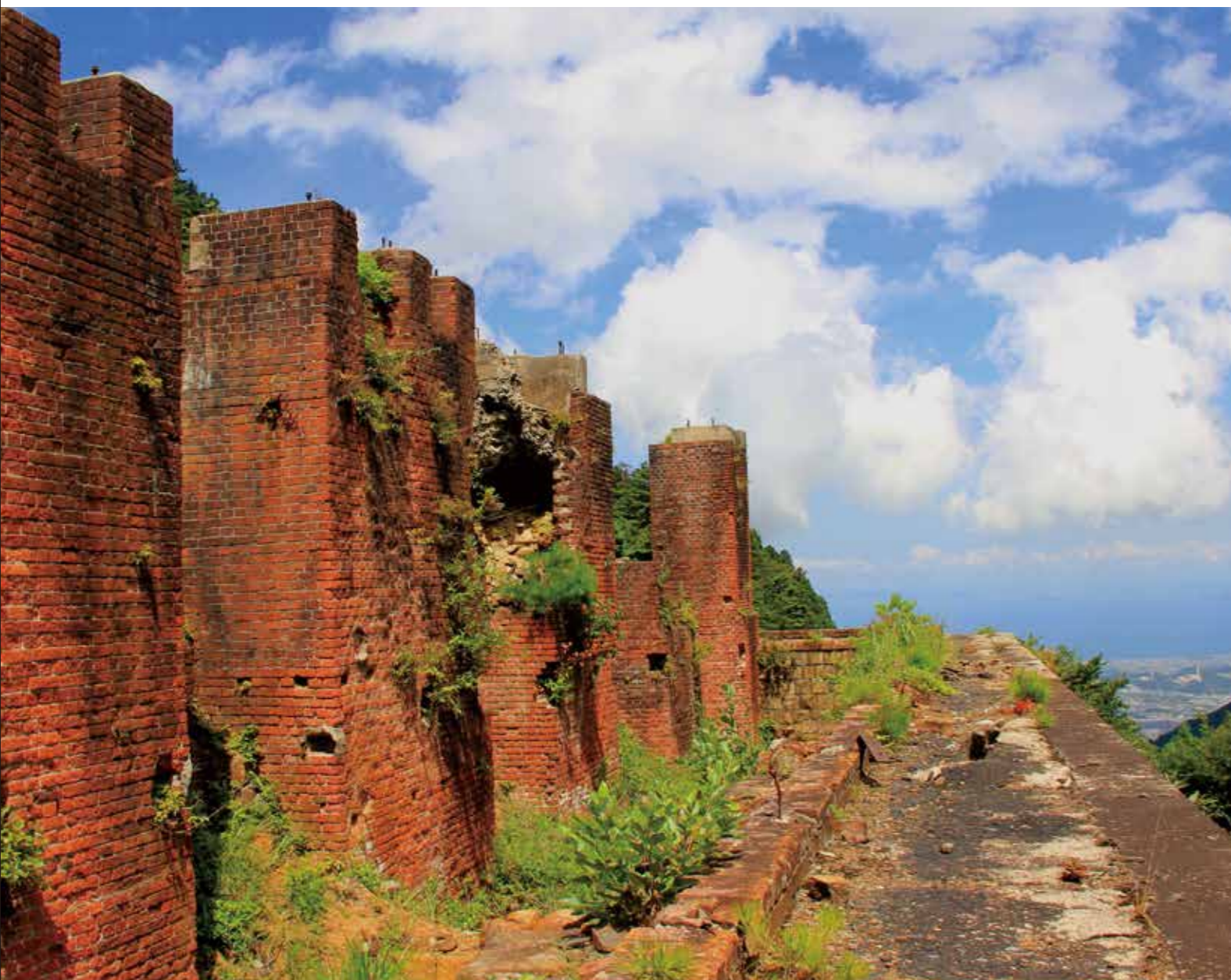
東平地區（別子銅礦山產業遺產）

別子銅礦山於 1691 年在海拔約 1200 米的山裡開始採礦。到閉礦為止的 1973 年，共歷經了 283 年，在這期間，採掘深度已經達到了海平面以下 1000 米處，並開採出了約 65 萬噸銅。別子銅礦山是日本歷史上屈指可數的銅礦山之一。