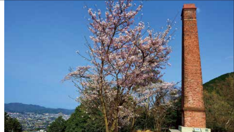
舊山根冶煉廠煙囪