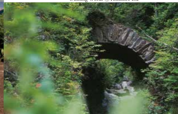
舊別子銅礦山地區 the 80th anniversary prize 2017 Akagane Photo Contest Winning Works