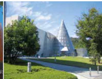
愛媛縣綜合科學博物館