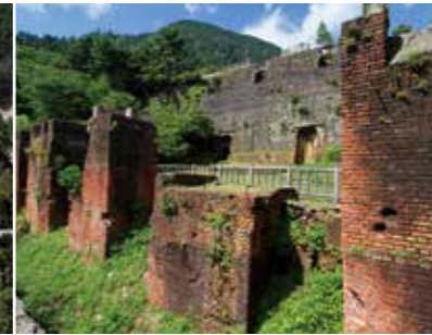
Minetopia 別子 東平地區