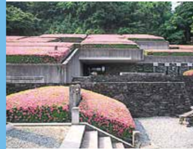
別子銅礦山紀念館