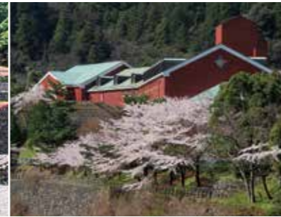
Minetopia 別子 端出場地區