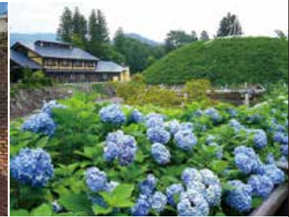
森林公園 Yuragi 森林