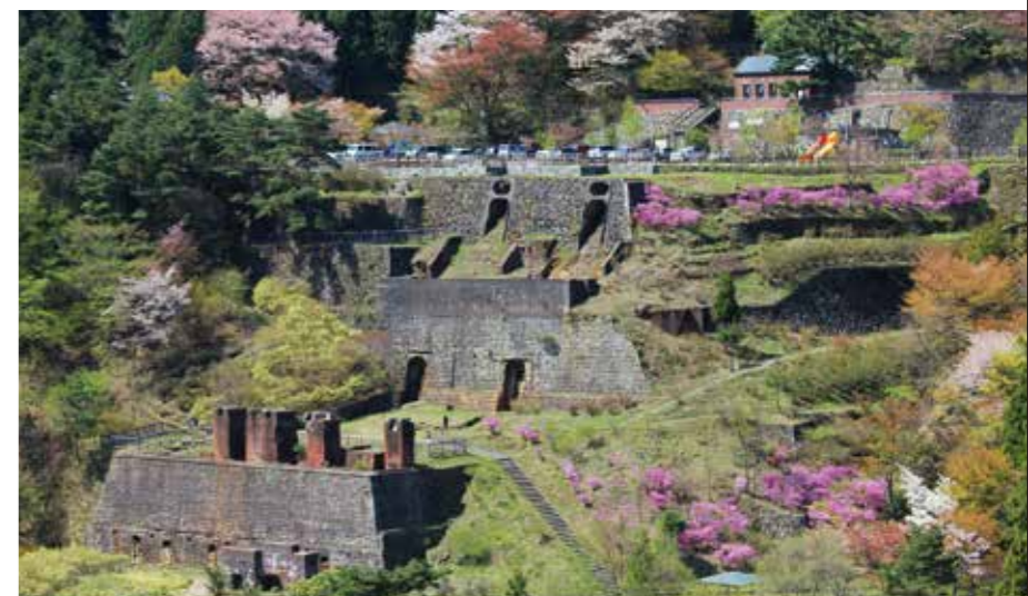
東平地區（別子銅礦山產業遺產）